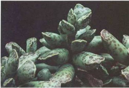
Adromischus cooperi (Baker) A. Berger

Adromischus cooperi is een mimiplantje uit zuid Afrika. De ronde gemarmerde blaadjes groeien in een rozet aan een heel kort stammetje. De bloempjes verschijnen aan een lange stengel maar zijn onbeduidend. Dit leuke vetplantje zal het beste groeien bij een